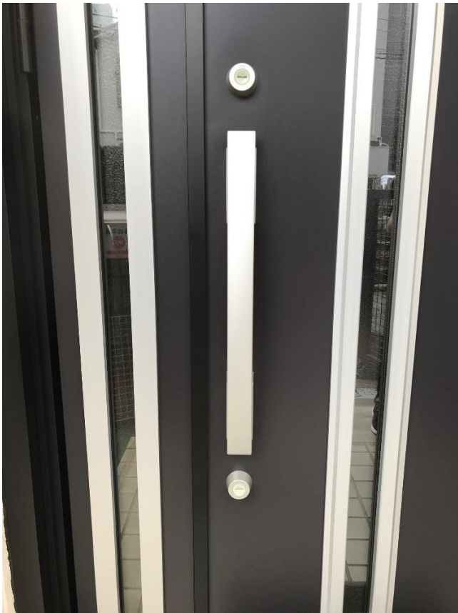
安心のダブルロック！